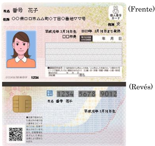
【Tarjeta de número personal】