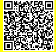
Formulário de inscrição

② Também pode se inscrever usando o formulário do Google da direita.