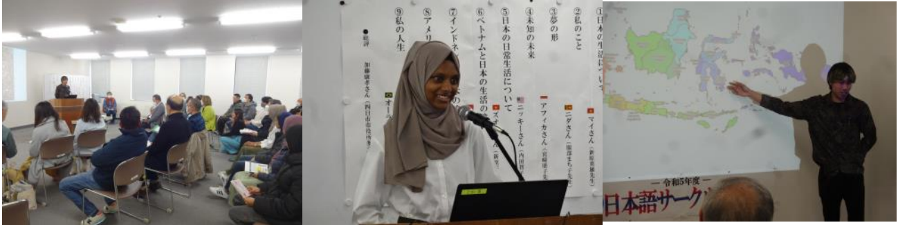
令和5年3月に開催した「日本語サークル発表会」の発表者

YIC日本語サークルで学習した日本語を使ってスピーチや歌などを発表する「YIC日本語サークル発表会」を3月23日（日）に行います。皆様の参加をおまちしています。