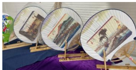
「日永うちわ」の展示

ラウンジを利用して日本人市民と外国人市民が交流するイベントや日本の文化を紹介する展示会を開催しました。