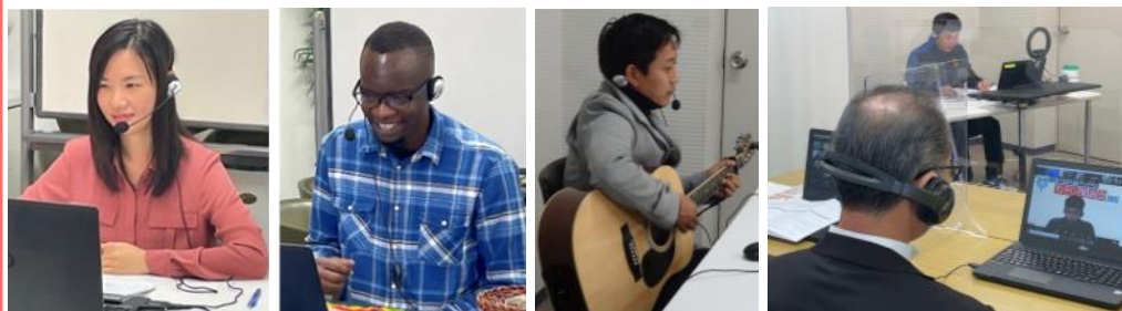
コーヒブレイク「マレーシア」「ジンバブエ」