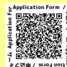
Formulario de inscripción